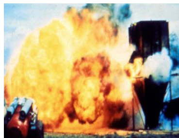
Figura 2: A poeira que sai do vent continua a queimar fora do equipamento

O diagrama do CSB mostra que as explosões de poeiras combustíveis ocorrem em muitos tipos de indústrias e operações. Embora a indústria química detenha uma pequena fração das explosões estudadas, a manipulação de sólidos pode ocorrer em qualquer parte do fluxo do produto, desde o recebimento da matéria-prima até o produto final.