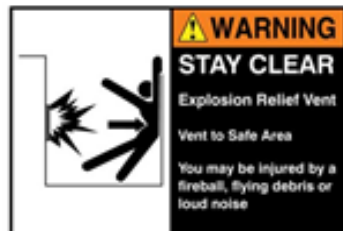
Figura 3: Placa de advertência de descarga de explosão